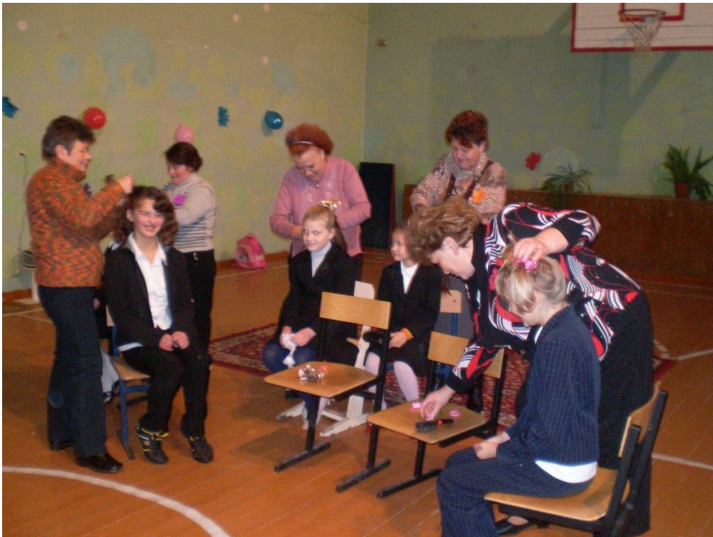
Праздник русской березки