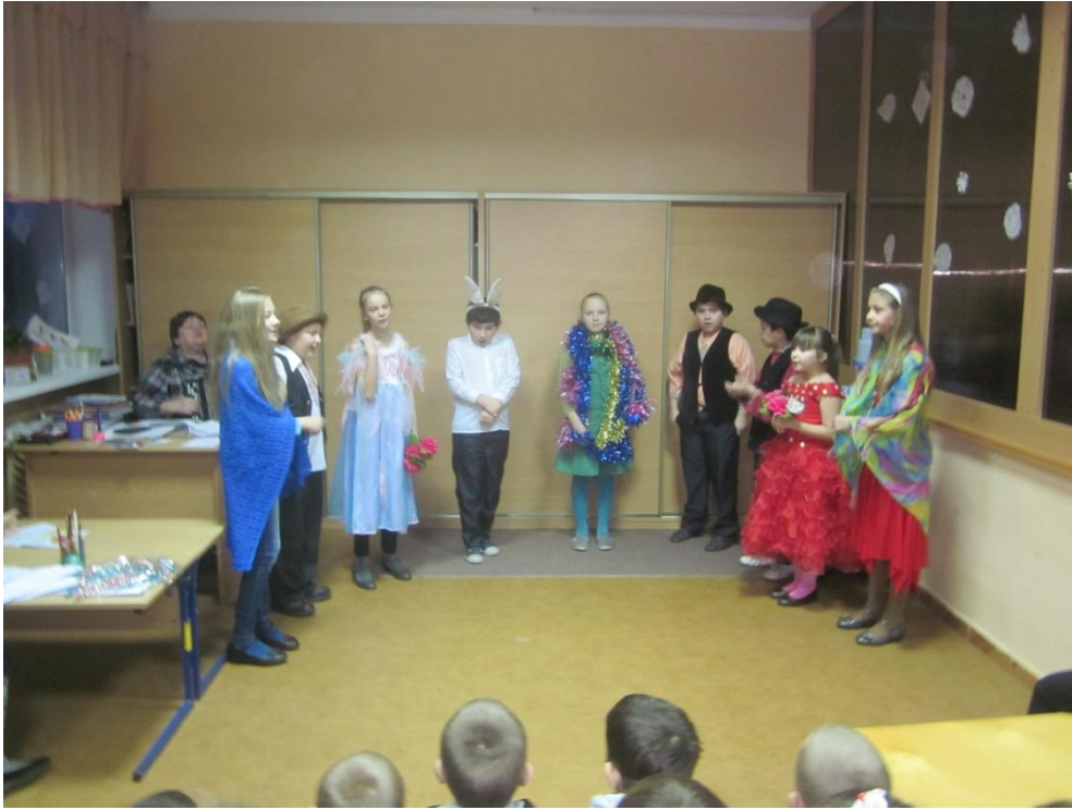
Утренник «С любовью к бабушке»